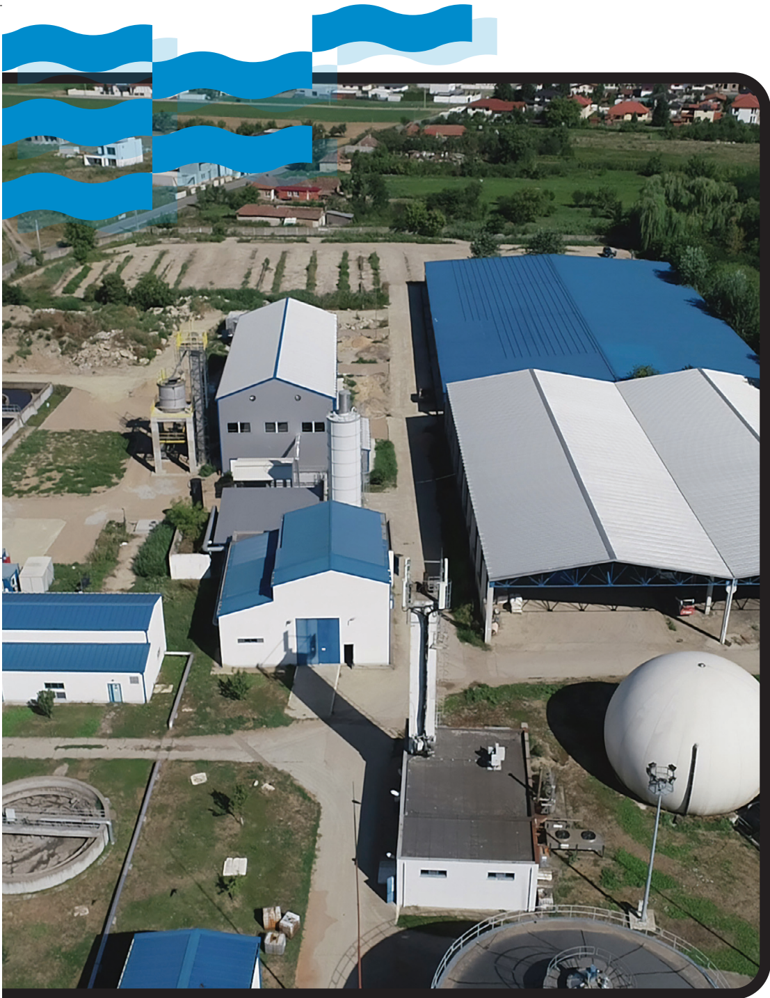
Contract POIM-SM-CL-14: Stația de epurare a apelor uzate Satu Mare