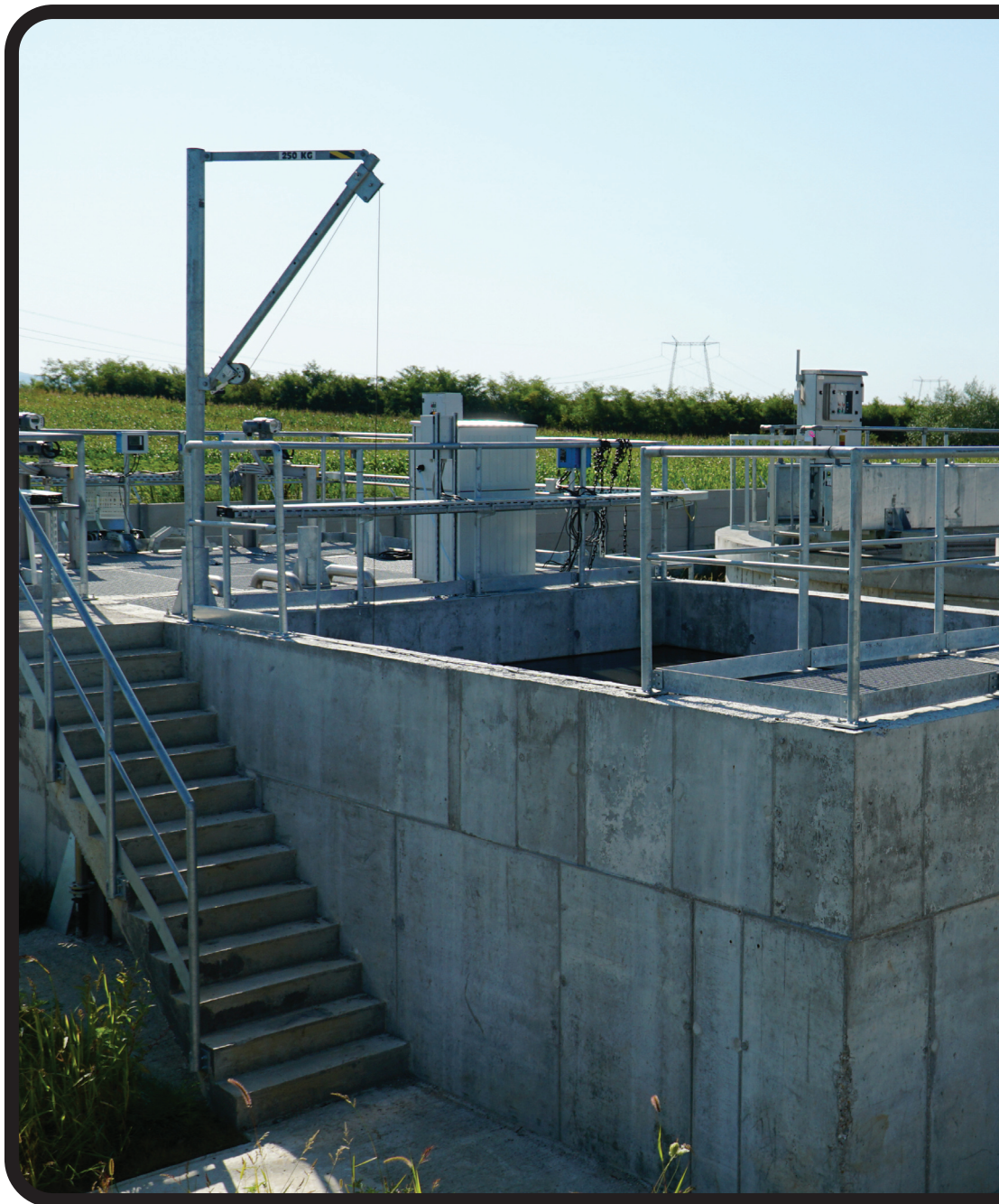
POIM-SM-CL-13 szerződés: Az aranyosmeggyesi szennyvíztisztító telep