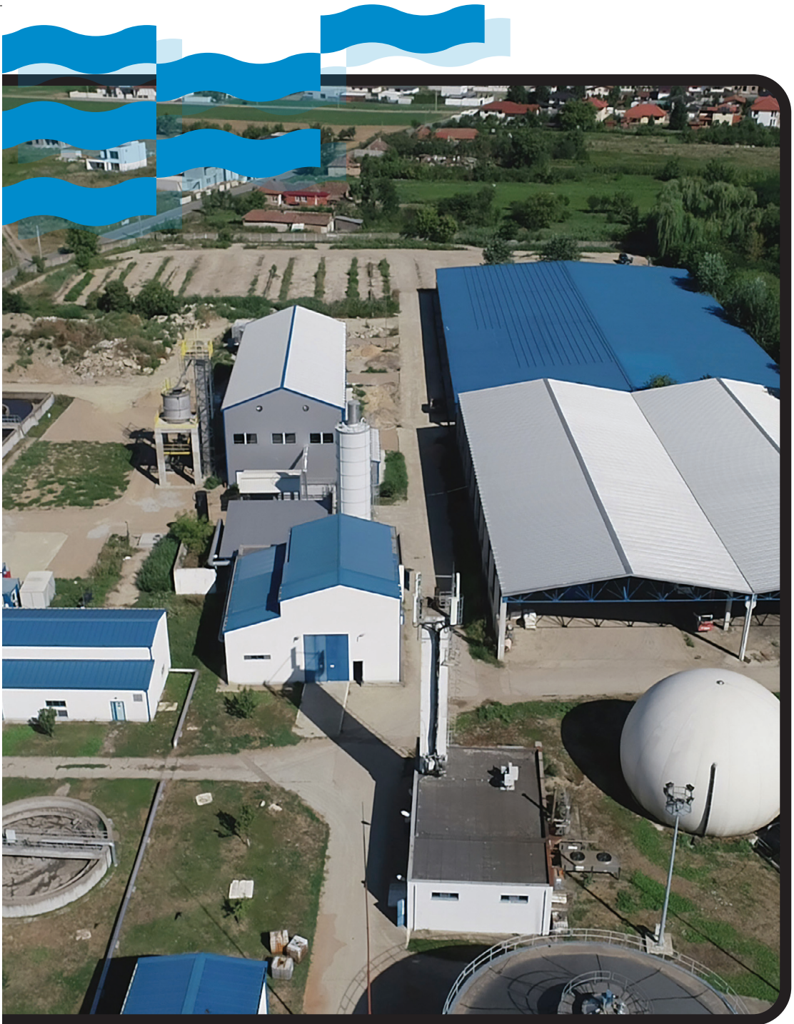
POIM-SM-CL-14 szerződés: A szatmárnémeti szennyvíztisztító telep