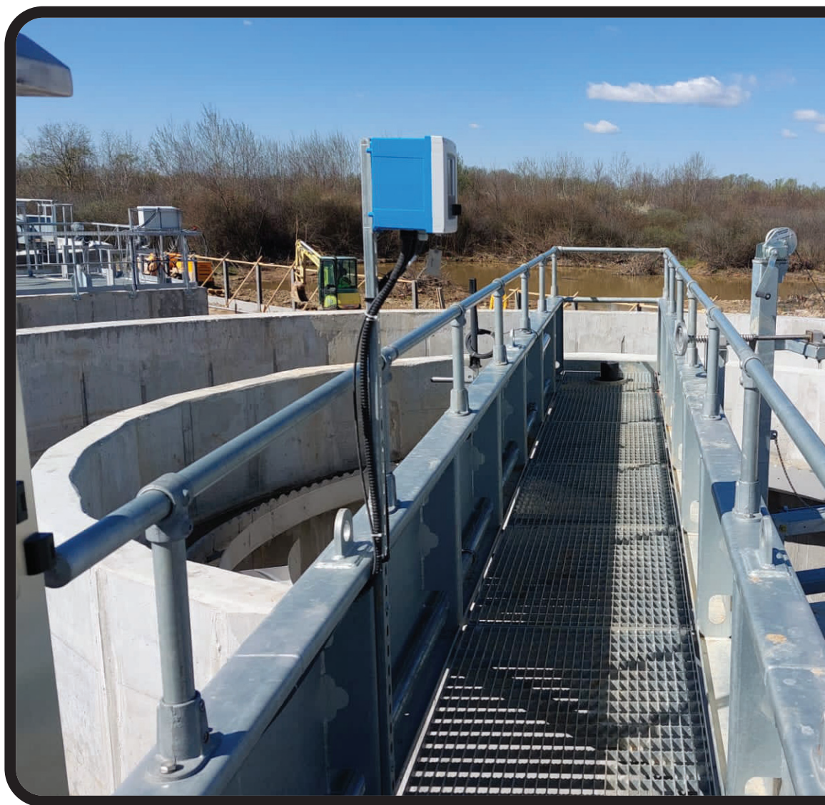
Contract POIM-SM-CL-12: Stația de epurare a apelor uzate Bătarci