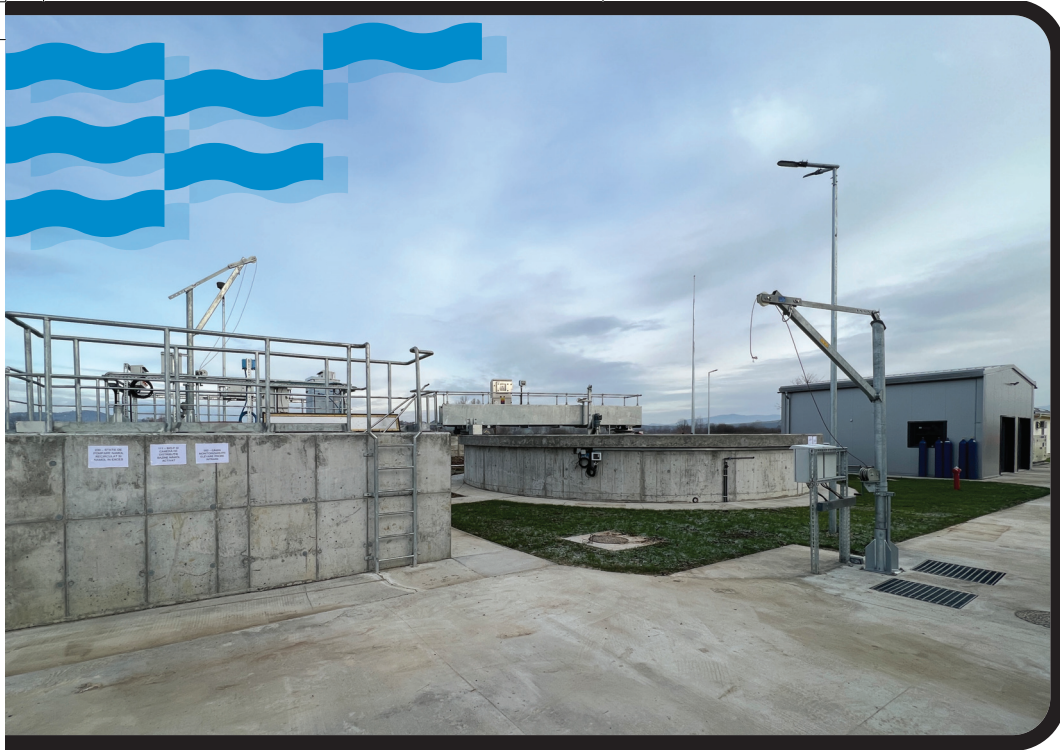
Contract POIM-SM-CL-12: Stația de epurare a apelor uzate Orașu Nou

servicii privind implementarea lucrărilor și perioada de garanție;