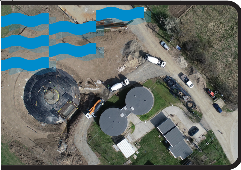
Contract POIM-SM-CL-07: Gospodăria de apă din orașul Tășnad - construirea rezervorului de apă