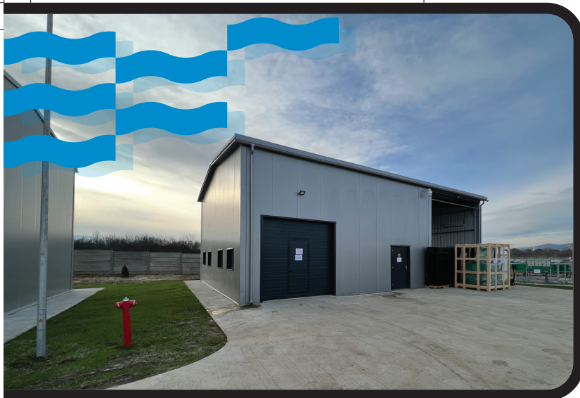
Contract POIM-SM-CL-12: Stația de epurare a apelor uzate Orașu Nou

Obiective: furnizarea, testarea, montarea, instalarea și asigurarea funcționării echipamentelor de laborator pentru Stația de tratare a apei potabile Mărtinești. Echipamentele achiziționate vor permite analiza mult mai complexă a calității apei, care va contribui la îmbunătățirea și eficientizarea monitorizării calității apei potabile. Echipamentele se vor folosi în activitatea specifică de determinare a diferitelor clase de pesticide, trihalometani, hidrocarburi policiclice aromatice, tetracloretan, tricloretenă etc.