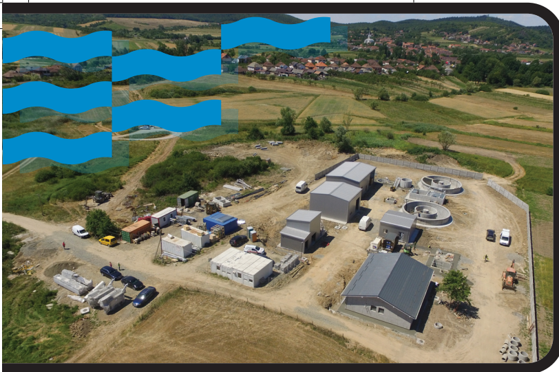
POIM-SM-CL-12 szerződés: Az avasújívárosi szennyvíztisztító-állomás

Lunaforrás, Túrvekonya, Avasújfaló, Lajosvölgy és Mózesfaló településeken, összesen közel 84 kilométer hosszúságban, 3383 rácsatlakozással. A szerződés magába foglalja 12 ivóvízszivattyú megépítését, valamint a szennyvízhálózat kiépítését Avasfelsőfaló, Lunaforrás és Túrvekonya településeken, hozzávetőleg 42,5 kilométer hosszúságban, 1865 rácsatlakozással. A szerződés által megépül 30 szennyvízszivattyú-telep és 12,5 kilométernyi magasnyomású vezeték.