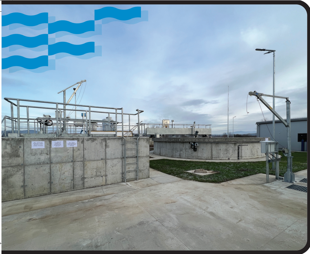
POIM-SM-CL-12 szerződés: az avasúvárosi szennyvíztisztító telep