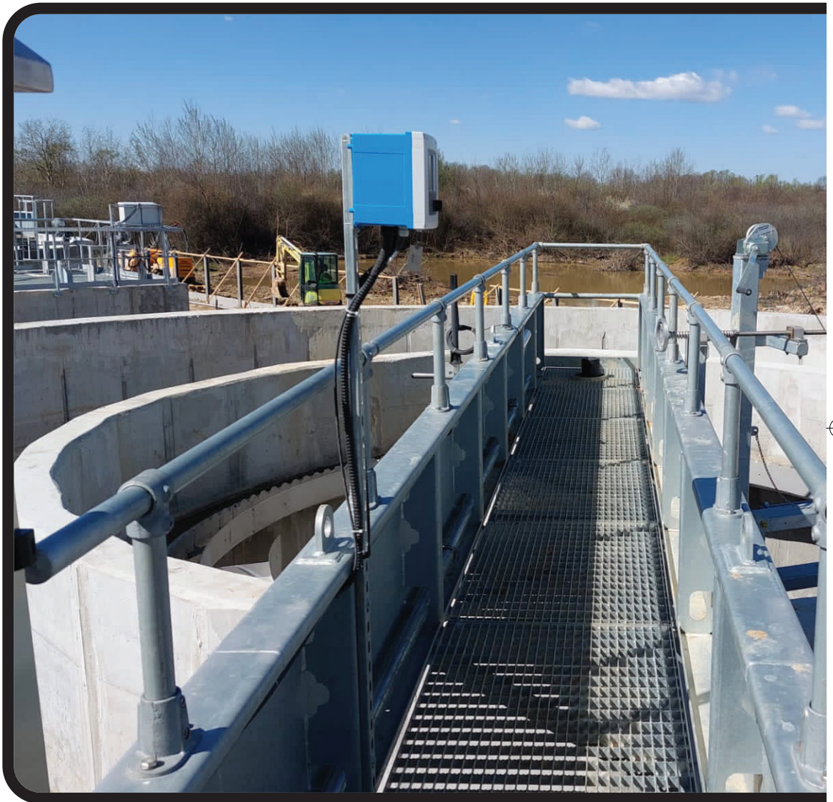
POIM-SM-CL-12 szerződés: a batarcsi szennyvíztisztító telep