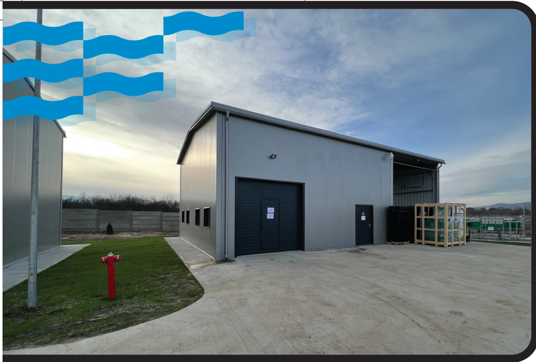
POIM-SM-CL-12 szerződés: az avasúvárosi szennyvíztisztító telep

teszik az ivóvíz minőségének komplexebb elemzését és a még jobb minőség biztosítását. Ezen felszereléseket elsősorban a vegyszerek, trihalometánok, policiklikus aromás hidrokarbonátok, tetrakloretánok, triklór-etilének azonosítása során fogják használni.